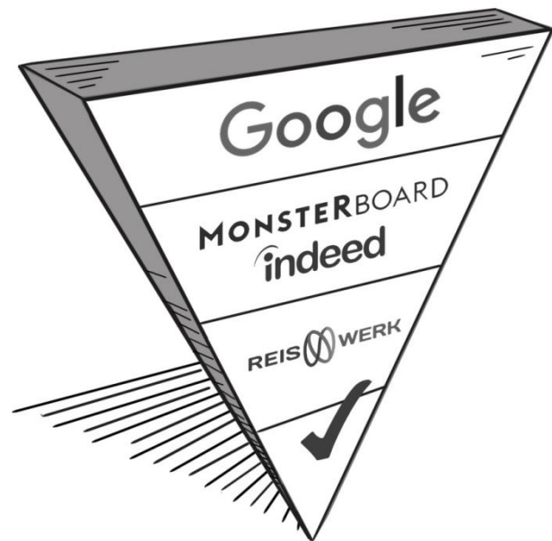
Figuur 1. 80% van de kandidaten start de zoektocht naar vacatures op één van de zoekmachines. Vervolgens beland de kandidaat op één van de jobsites om vervolgens op jouw website te belanden.

En dat betekent dat je als werkgever veel beter je best moet doen om op te vallen tussen het vacaturegeweld. De vindbaarheid van je vacature is altijd 'key'. Want, zo grapt het internet: de beste plek om een lijst te verbergen, is op de tweede pagina van Google. En daar zit wel een kern van waarheid in. Belandt jouw vacature op de tweede pagina van Google, Indeed of één van de andere jobboards? Kleine kans dat hij wordt opgepikt.